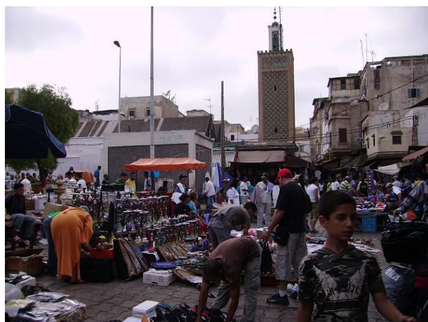
Le souk de Casablanca

Pour l'expo à Tanger, voyez le site : http://www.expo2012.ma/web/index.asp