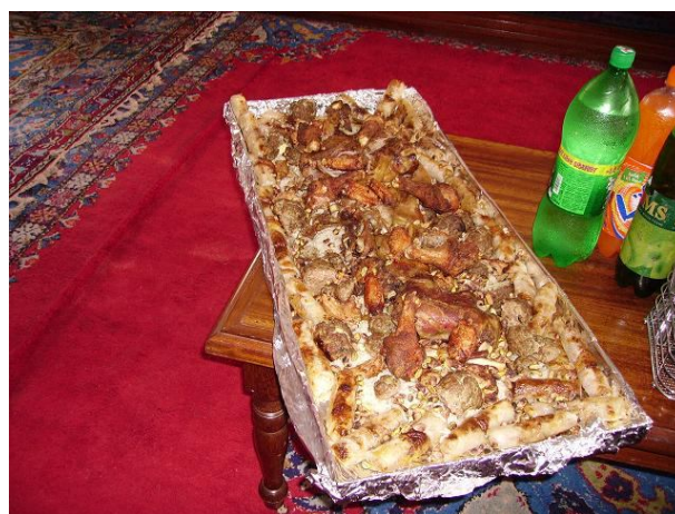
Les plaisirs culinaires