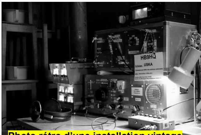
Photo rétro d'une installation vintage