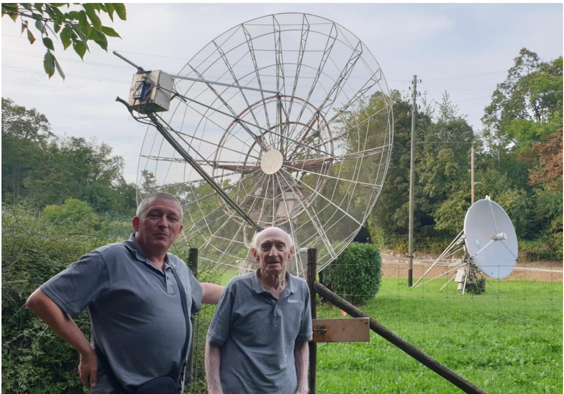
Paraboles pour EME à 1.3GHz (gauche) et à 5 et 10GHz (droite)

Nous avons aussi passé quelques bon moment au Serpiano où il y avait le local du groupe équipé de 4 antennes 144 pour l'EME. Nous y faisons la fête des châtaignes. Que des bons souvenirs.