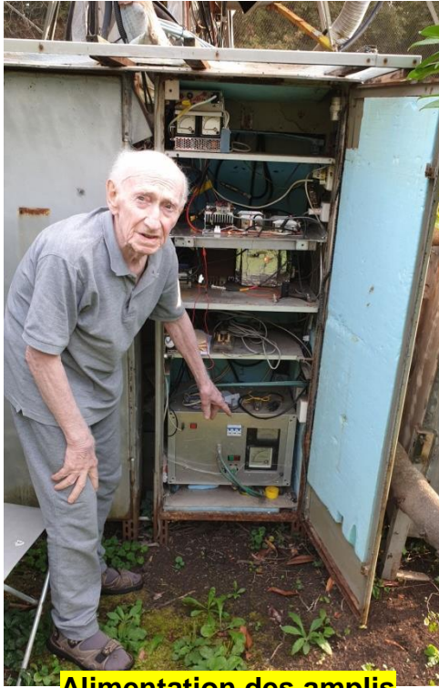
Alimentation des amplis sous la parabole