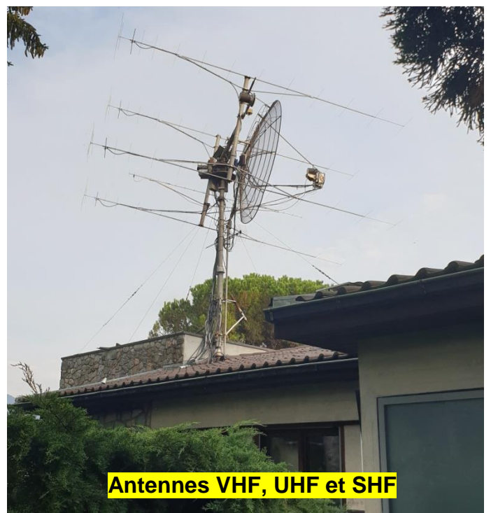
Antennes VHF, UHF et SHF